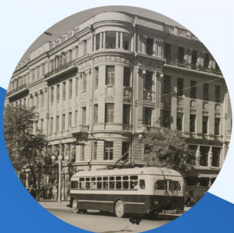
РОСТОВСКИЙ ИНСТИТУТ НАРОДНОГО ХОЗЯЙСТВА 1967 г.