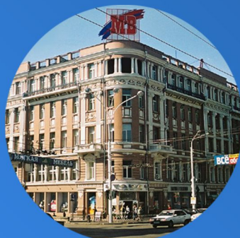
РОСТОВСКАЯ ГОСУДАРСТВЕННАЯ ЭКОНОМИЧЕСКАЯ АКАДЕМИЯ 1994 г.