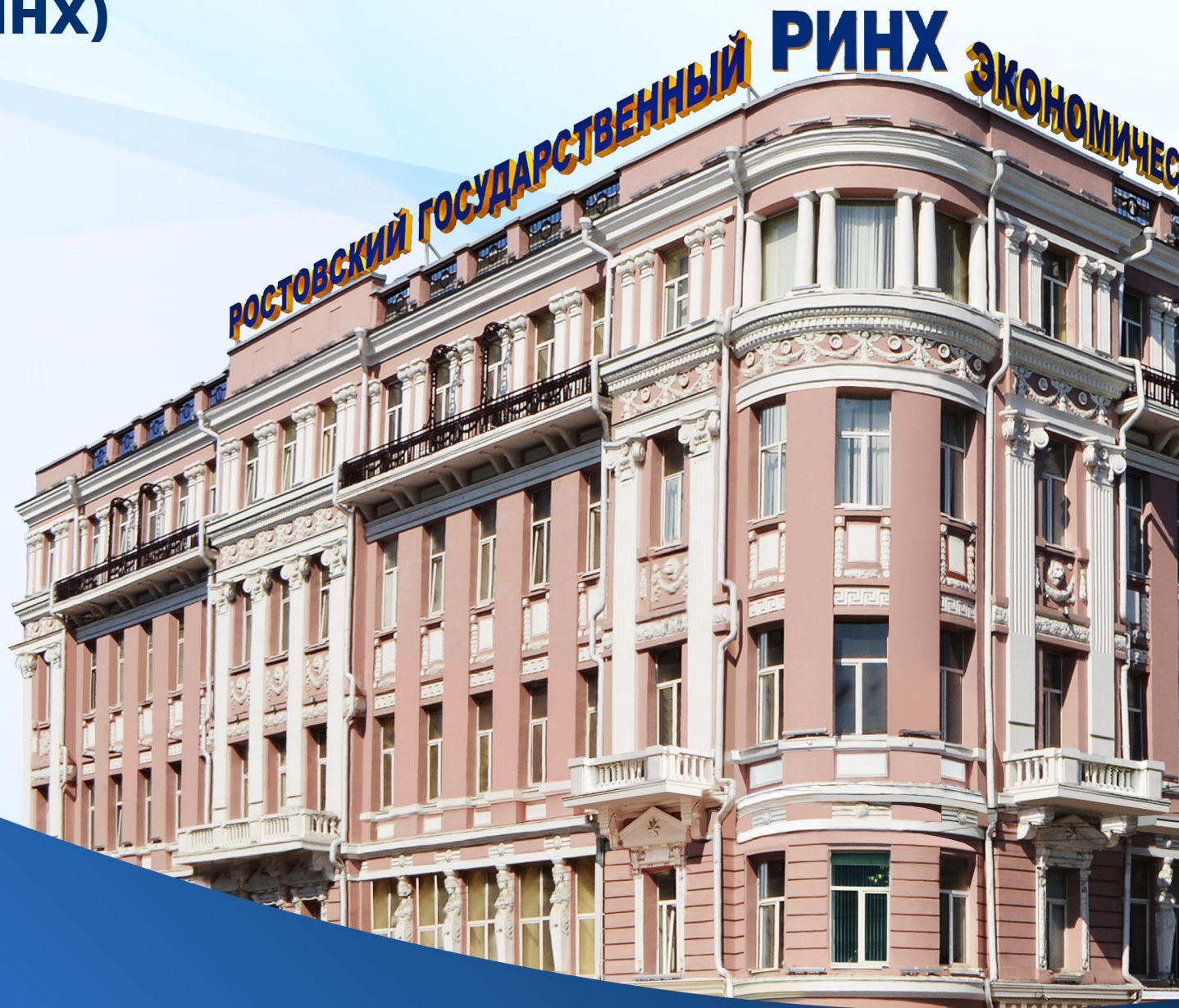
РОСТОВСКИЙ ГОСУДАРСТВЕННЫЙ ЭКОНОМИЧЕСКИЙ УНИВЕРСИТЕТ (РИНХ) с 2000 г.