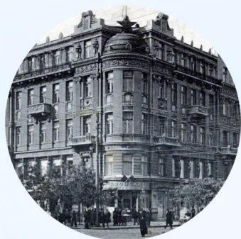
РОСТОВСКИЙ ФИНАНСОВО- ЭКОНОМИЧЕСКИЙ ИНСТИТУТ 1931 г.