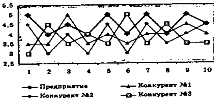
Рис. 1. Профиль относительного качества услуг

По результатам представительного опроса экспертов (потребителей) находятся по пятибалльной шкале осредненные оценки приведенных критериев для данного предприятия (Пр) и трех его конкурентов К1, К2 и К3 (табл. 1). Эти оценки наносятся на график и делается заключение относительно положения данного предприятия по сравнению с его конкурентами (рис. 1.).