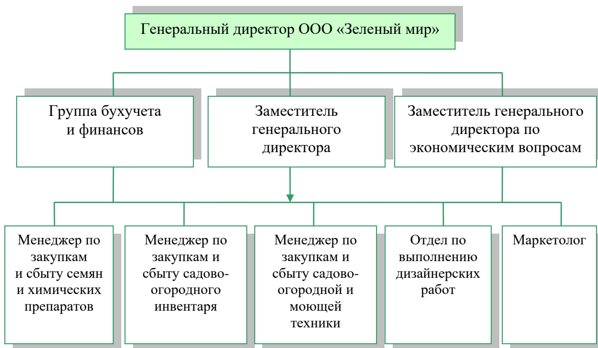
Рисунок 1 – Организационная структура предприятия ООО «Зеленый мир»

– химические препараты: удобрения для уличных и комнатных культур; препараты по борьбе с различными насекомыми-вредителями.