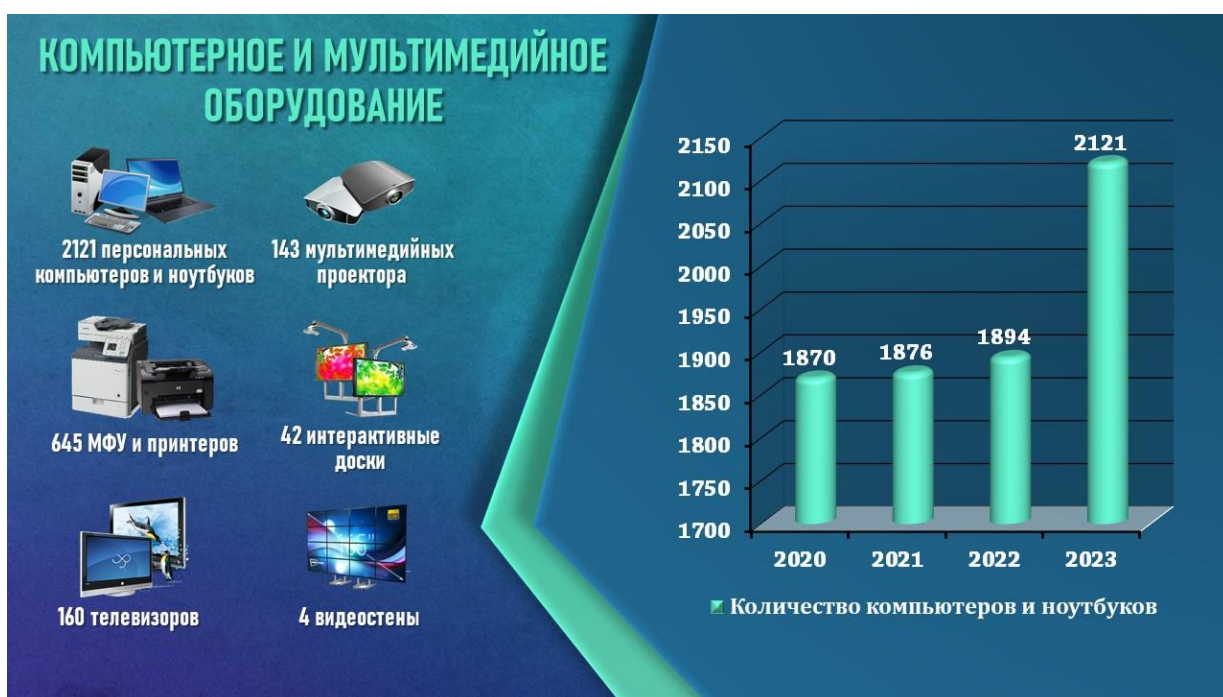
Рисунок 4 – Состав компьютерного и мультимедийного оборудования РГЭУ(РИНХ)

Ускоренными темпами в 2023 году проводилось обновление и расширение учебной компьютерной базы колледжа, введены в эксплуатацию 5 новых компьютерных классов с более чем 140 посадочными местами. Все компьютерные классы колледжа обеспечены отечественными программными средствами.