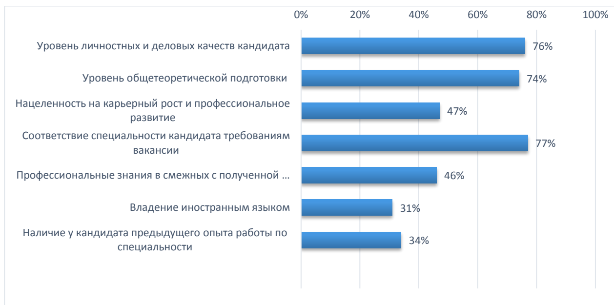
Рисунок 1 - Критерии выбора кандидатов при приеме на работу выпускников РГЭУ (РИНХ)

Помимо наличия предыдущего опыта работы, при приёме на работу работодатели оценивают в первую очередь личностные качества кандидатов, уровень профессиональной и теоретической подготовки, а также нацеленность кандидатов на карьерный рост и профессиональное развитие (рис.1).