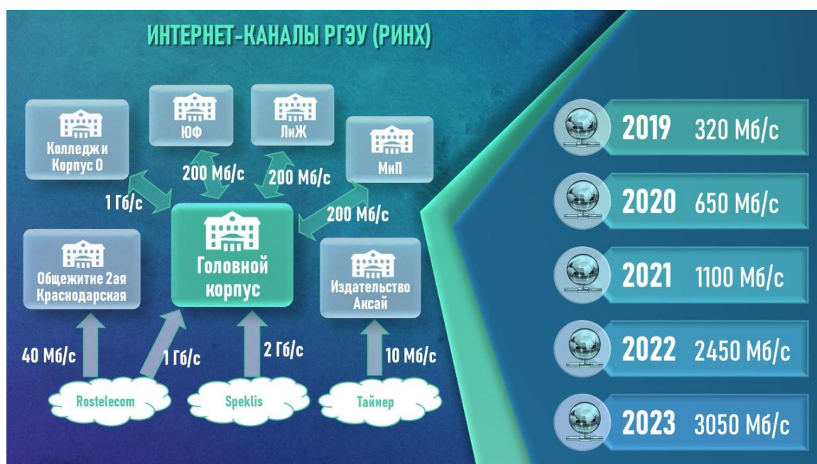
Рисунок 3 - Пропускная способность интернет каналов РГЭУ(РИНХ)

Суммарная мощность интернет-каналов вуза составила более 3 Гб/с, т.е. 0.5 Мб/с на одного студента очной формы обучения. Оптоволоконный канал, соединяющий головной вуз и серверный центр колледжа расширен в 10 раз до 1Гб/с, каналы связи с корпусами увеличены в 2 раза.