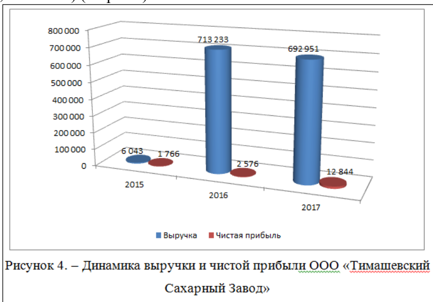
Рисунок 4. – Динамика выручки и чистой прибыли ООО «Тимашевский Сахарный Завод»

При оформлении рисунка в виде диаграммы в названии рисунка необходимо указать в том числе название страны, наименование организации (например, в США; в России; ПАО «Сбербанк России» и т.п.), период исследования (например, за 2011-2016 гг.; в 2016 году (по месяцам) и единицы измерения (например, млн.руб.; %; шт. и т.п.) (см.рис.2).