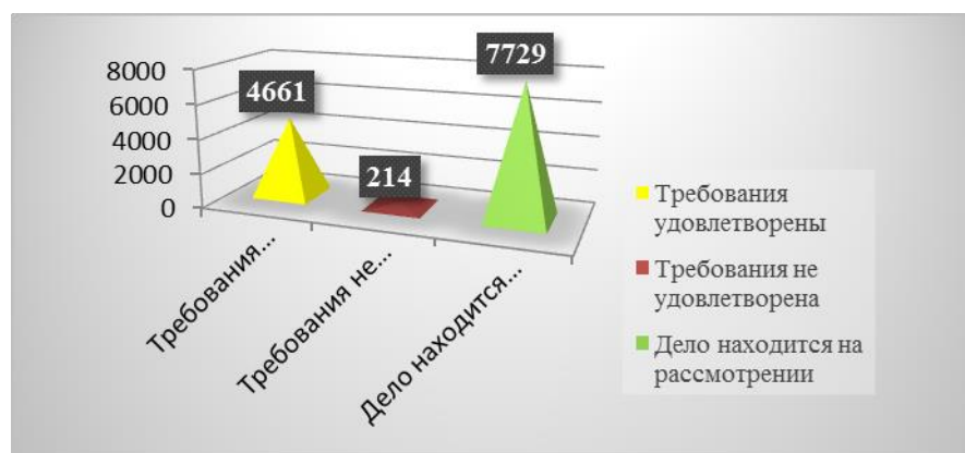
Рисунок 2. 3 – Результаты рассмотрения в судебном порядке споров о величине кадастровой стоимости в России и установлении ее в размере рыночной стоимости по состоянию на 1 сентября 2020 г.,% [38, с. 43]