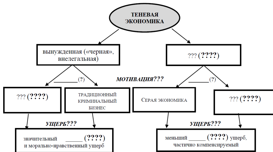
Рис. 3. Общая характеристика типов и разновидностей теневой экономики

Задание 2. Внесите в схему (рис. 3) недостающую информацию.