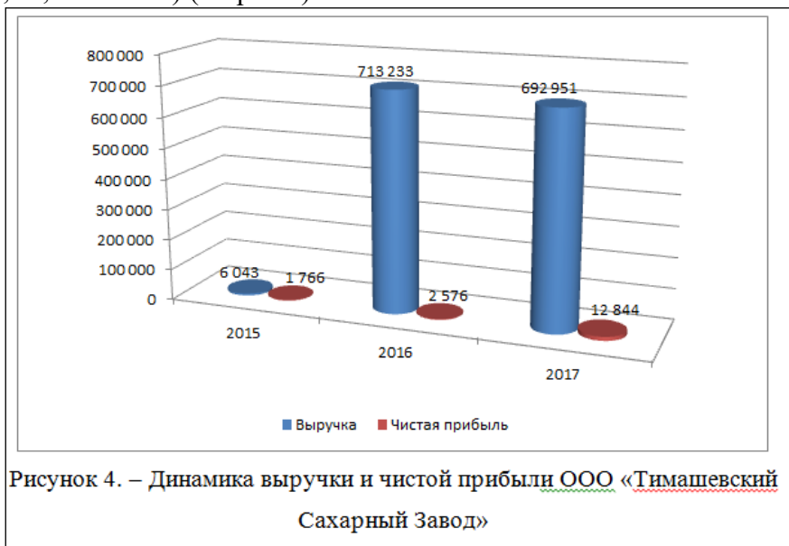
Рисунок 4. – Динамика выручки и чистой прибыли ООО «Тимашевский Сахарный Завод»

При оформлении рисунка в виде диаграммы в названии рисунка необходимо указать в том числе название страны, наименование организации (например, в США; в России; ПАО «Сбербанк России» и т.п.), период исследования (например, за 2011-2016 гг.; в 2016 году (по месяцам) и единицы измерения (например, млн.руб.; %; шт. и т.п.) (см.рис.2).