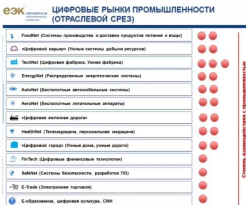
Рисунок 2 – Отраслевой подход 3

- определить отраслевой срез в рамках отраслевого подхода (рисунок 2) ;