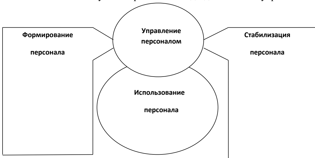
Схема 1. Направления и виды деятельности управления персоналом

1. Заполните схему 1 «Направления и виды деятельности управления персоналом».