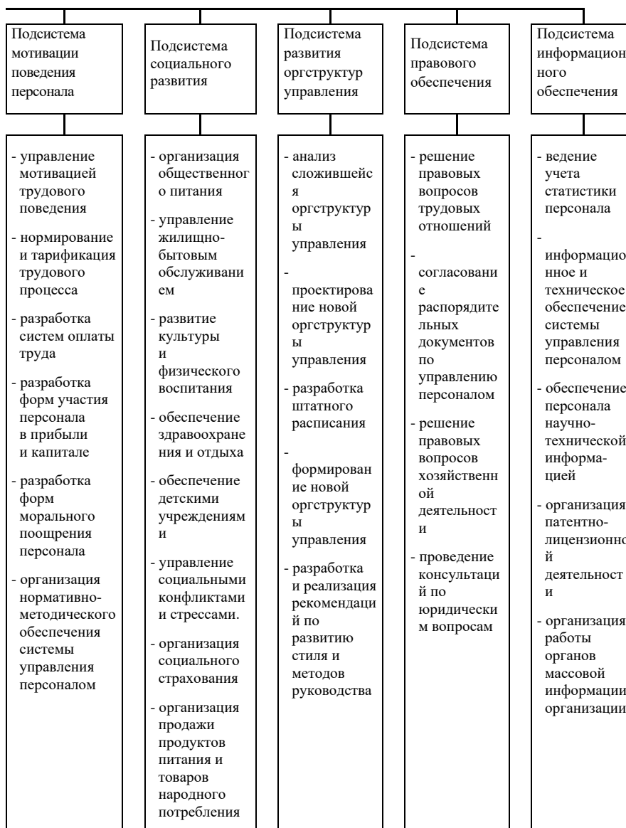
Рис. 1. Функциональные подсистемы в системе управления персоналом