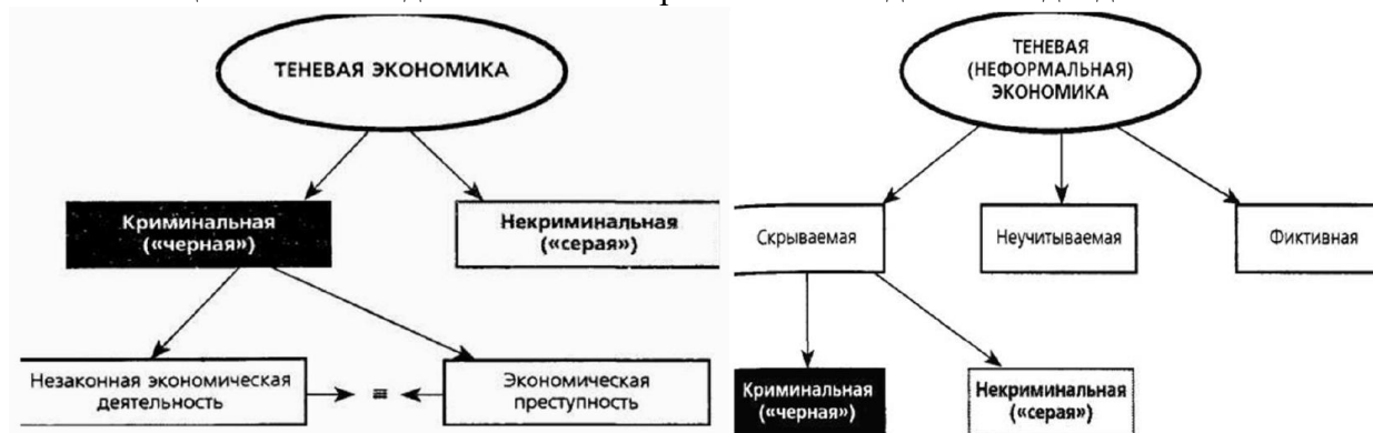
Рис. 1. Правовой подход к типологизации Рис. 2 Статистический подход к типологизации

Задание 1. Изучите типологизацию теневой экономики (рис. 1, рис.2). Выделите основные критерии типологизации. Назовите достоинства и ограничения каждого из подходов.