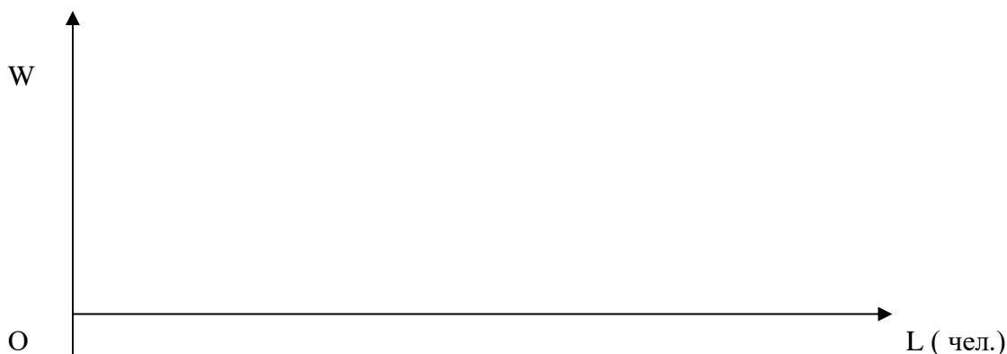
Рис.1 Решение о найме работников фирмой несовершенной конкуренции на совершенно- конкурентном рынке труда.

5. Дайте график, характеризующий найм работников исследуемой фирмы. Покажите на графике линии стоимости предельного продукта труда ( VMPL ), дохода от предельного продукта труда ( MRPL ) и линии предложения труда на совершенно- конкурентном рынке труда ( SL ).