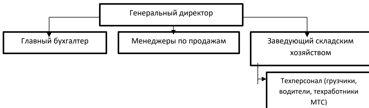
Рисунок 2.3 - Схема организационной структуры управления ООО «Донтехнополь»

Если ссылка на рисунок в тексте составляет часть предложения, то скобки не ставятся и сокращений не допускается. Например: " ... как показано на рисунке 2.3, на предприятии отсутствует структурное подразделение, непосредственно осуществляющее управление ВЭД, а данные функции возложены на менеджеров по продажам...".