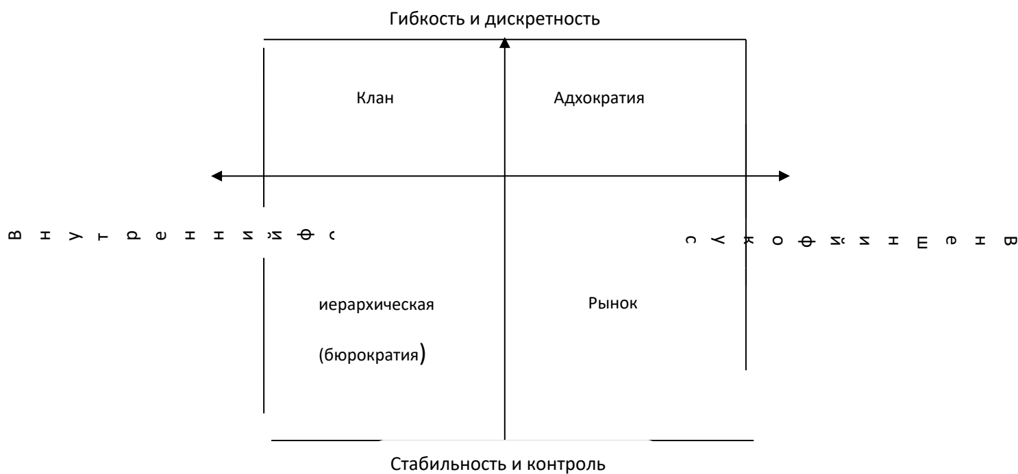
Рис. 1. Макет профиля организационной культуры.

параметры оценки в них одинаковы, разница состоит в том, что в первой части респондент характеризует нынешнюю культуру организации — то, как в ней обстоят дела на момент опроса. Во второй части он характеризует желаемое положение вещей — культуру своей компании, какой он хотел бы её видеть в будущем. Таким образом, оценивается одновременно нынешняя и желаемая организационная культура. Результаты отображаются в особой системе координат — профиле организационной культуры. Оси координат — стреловые ценности организационной культуры (гибкость и дискретность, и стабильность и контроль; внутренний фокус и интеграция, и внешний фокус и дифференциация). Каждый квадрант соответствует определенному типу культуры, а координаты точек рассчитываются как среднее арифметическое оценок, проставленных респондентами каждому типу культуры (отдельно для имеющейся и желаемой). Такое графическое представление удобно и наглядно, профиль организационной культуры позволяет максимально быстро оценить одновременно нынешнюю, предпочитаемую культуры и их соотношение. На рис. 1 изображен незаполненный профиль организационной культуры, а с вопросником ОСАІ можно ознакомиться в приложении 1.