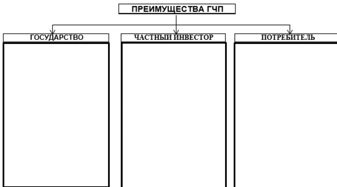
Схема 1 – Преимущества ГЧП