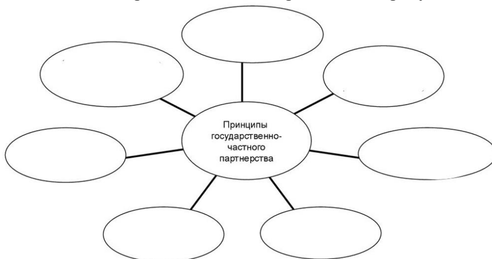
Рис. 1 – Принципы государственно-частного партнерства.

5. Назовите принципы ГЧП и отразите их на рисунке 1.