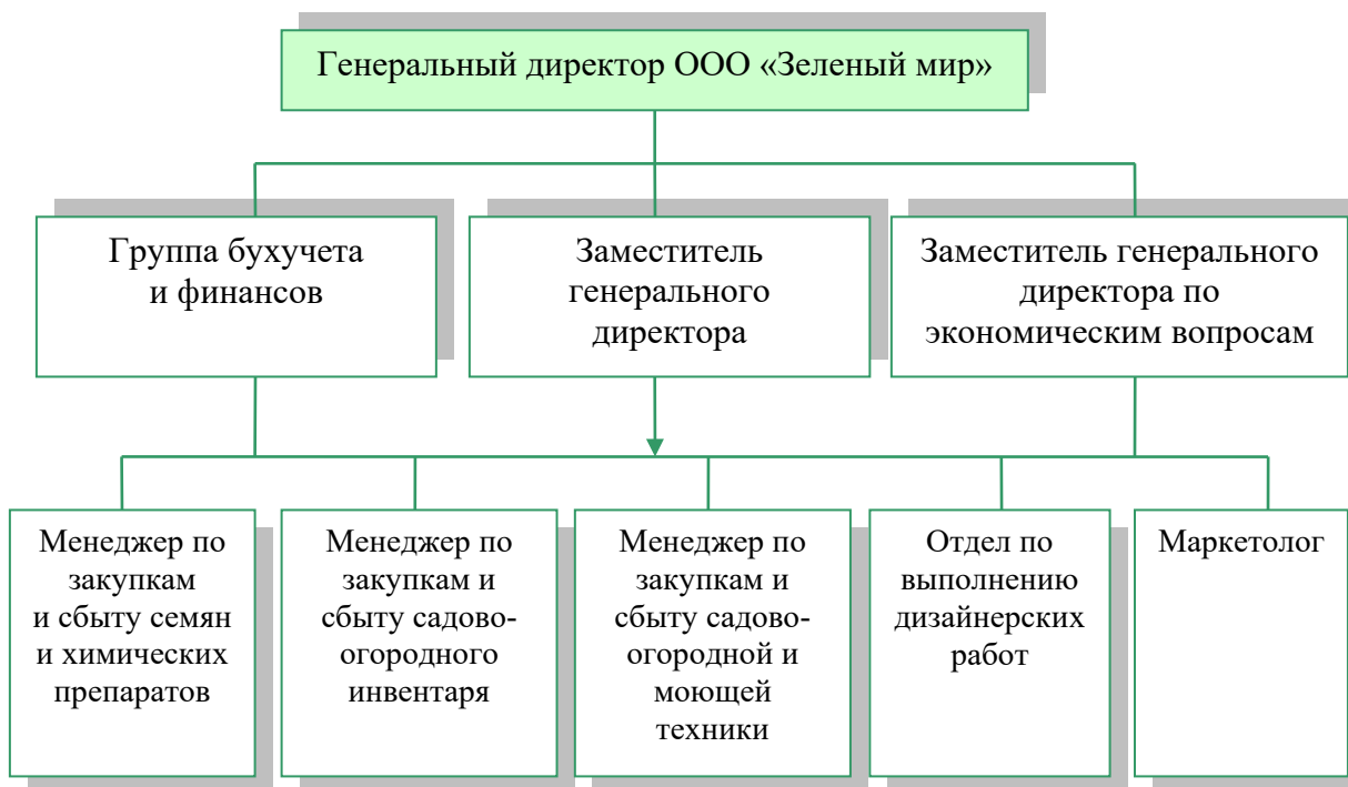
Рисунок 1 – Организационная структура предприятия ООО «Зеленый мир»

Так же «Зеленый мир» предоставляет услуги по оформлению садовых участков, парков и ландшафта. Данной работой занимаются дизайнеры, которые представляют свои услуги непосредственно в розничных точках. Клиентами ООО «Зеленый мир» являются как физические, так и юридические лица. Функции управления сбытом, а так же контроль осуществляют менеджеры отделов, к их основным функциям относится и поиск поставщиков, покупателей. Каждый год на, различные праздники, сотрудники ООО «Зеленый мир» рассылают фирменные письма с поздравлениями своим постоянным клиентам.