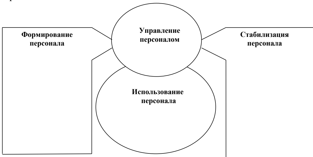
Схема 1. Направления и виды деятельности управления персоналом

1. Заполните схему 1 «Направления и виды деятельности управления персоналом».