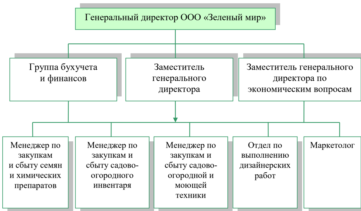
Рисунок 1 – Организационная структура предприятия ООО «Зеленый мир»

Так же «Зеленый мир» предоставляет услуги по оформлению садовых участков, парков и ландшафта. Данной работой занимаются дизайнеры, которые представляют свои услуги непосредственно в розничных точках. Клиентами ООО «Зеленый мир» являются как физические, так и юридические лица. Функции управления сбытом, а так же контроль осуществляют менеджеры отделов, к их основным функциям относится и поиск поставщиков, покупателей. Каждый год на, различные праздники, сотрудники ООО «Зеленый мир» рассылают фирменные письма с поздравлениями своим постоянным клиентам.