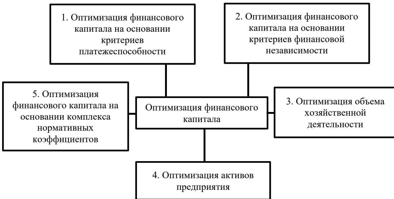
Рис. 1 - Схема комплексного подхода к процессу оптимизации финансового капитала