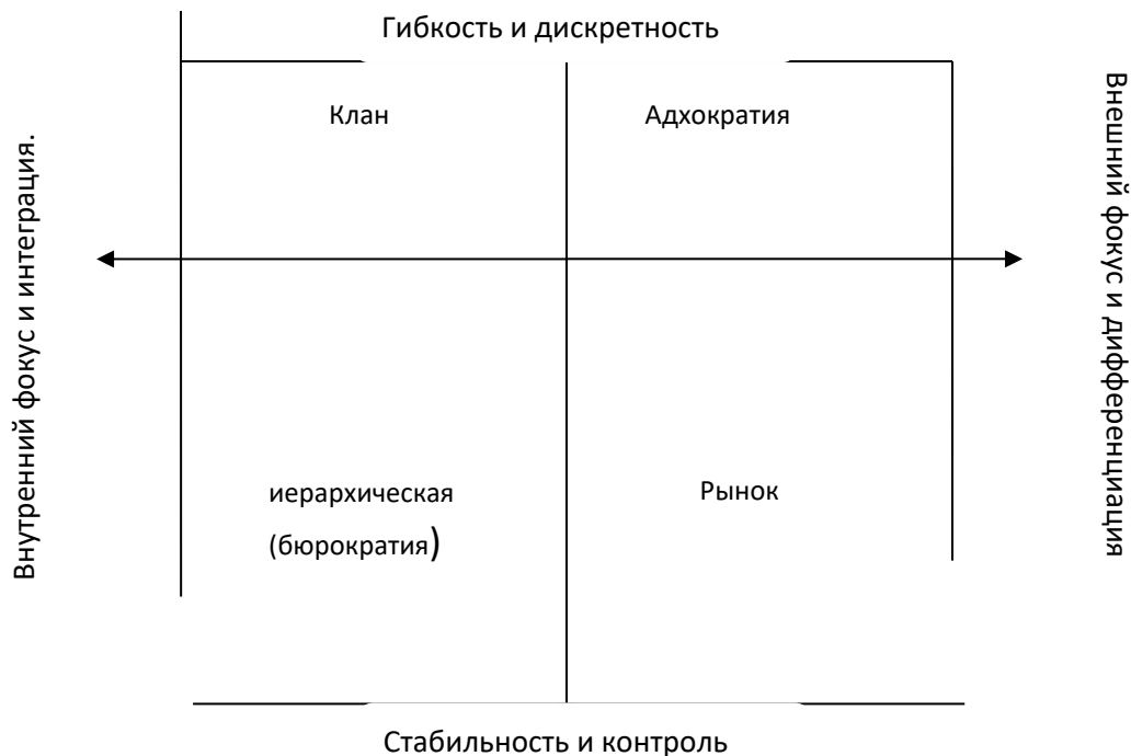
Рис. 1. Макет профиля организационной культуры.