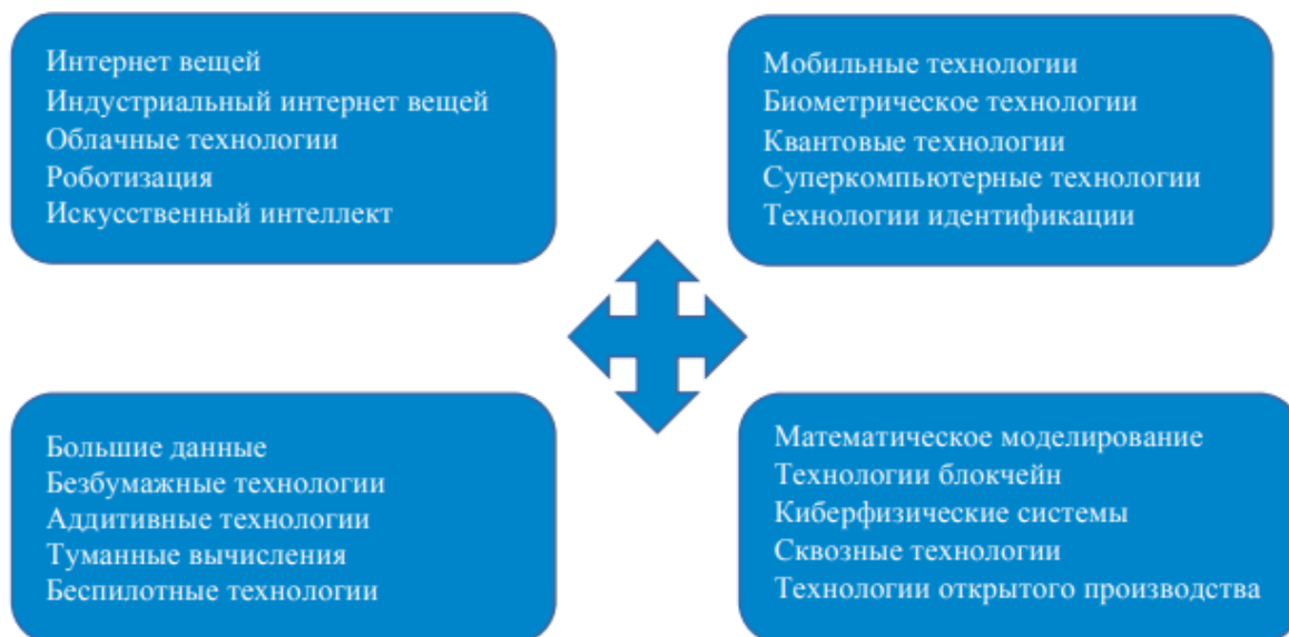
Рисунок 4 – Технологии цифровой трансформации экономики 4

- определить технологию цифровой трансформации экономики, приемлемую для предприятия (рисунок 4) ;