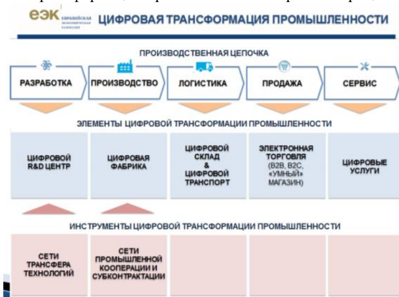
Рисунок 1 – Процессный подход