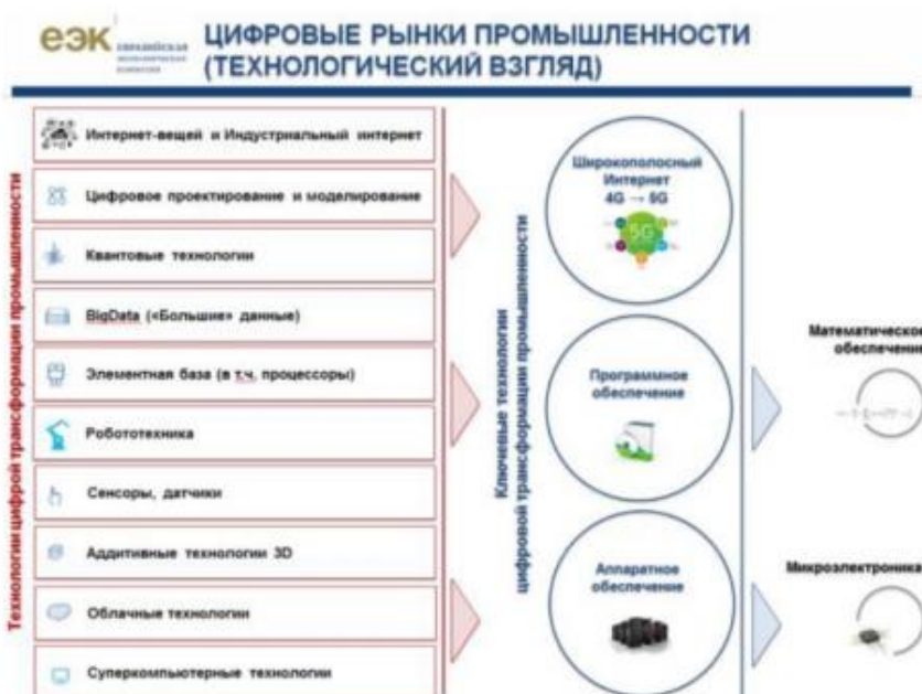
Рисунок 3 – Технологический подход

- определить технологию цифровой трансформации экономики, приемлемую для предприятия (рисунок 4) ;