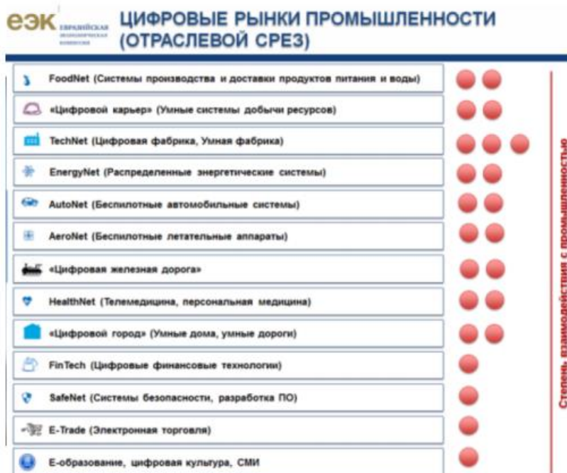
Рисунок 2 – Отраслевой подход 3