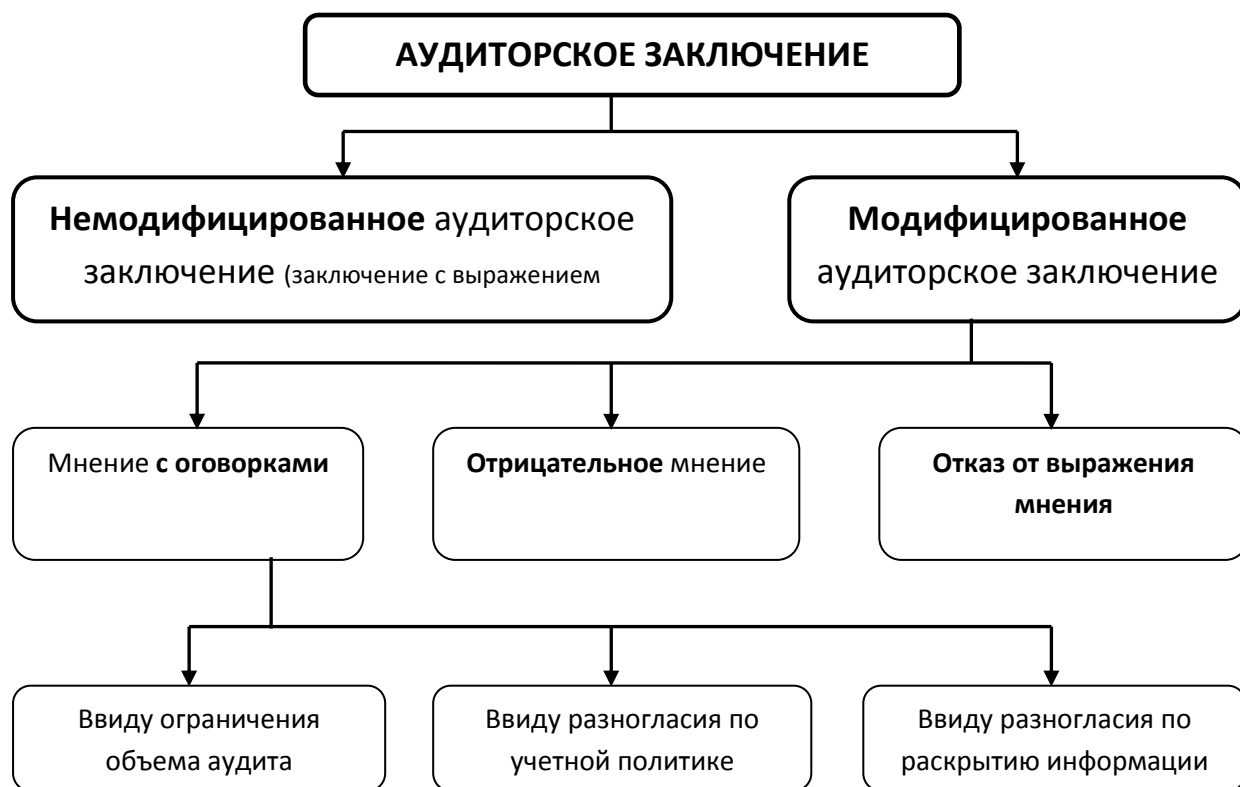
Рисунок 3. Виды аудиторских заключений