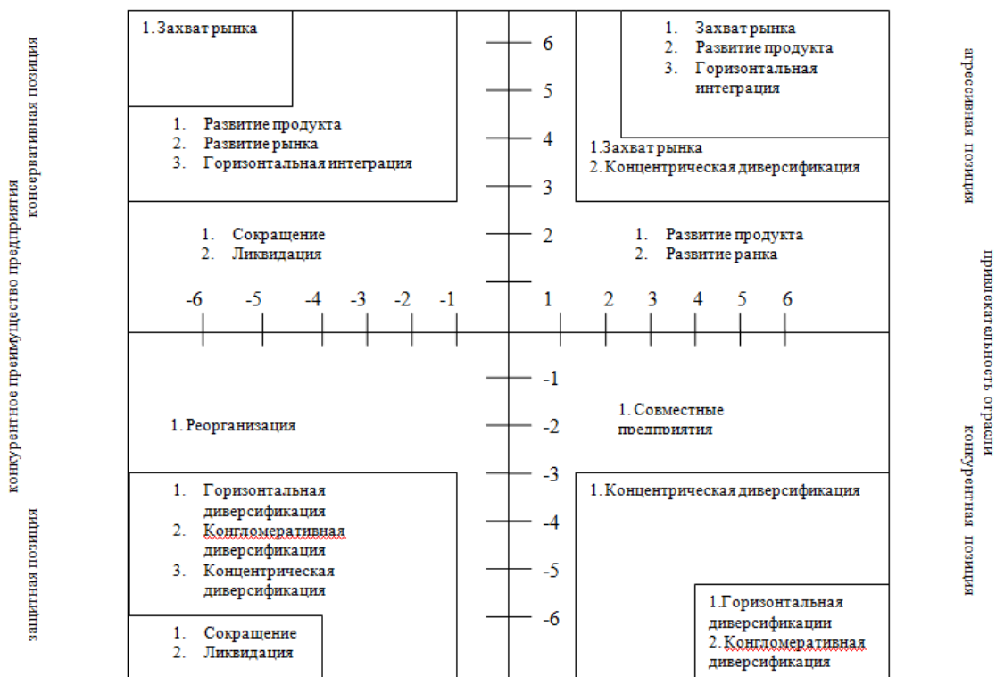
Стабильность среды деятельности