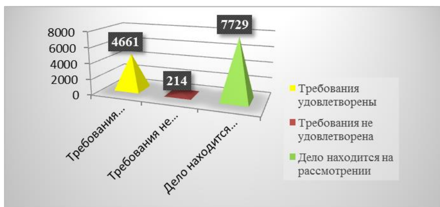
Рисунок 2. 3 – Результаты рассмотрения в судебном порядке споров о величине кадастровой стоимости в России и установлении ее в размере рыночной стоимости по состоянию на 1 сентября 2020 г.,% [38, с. 43]