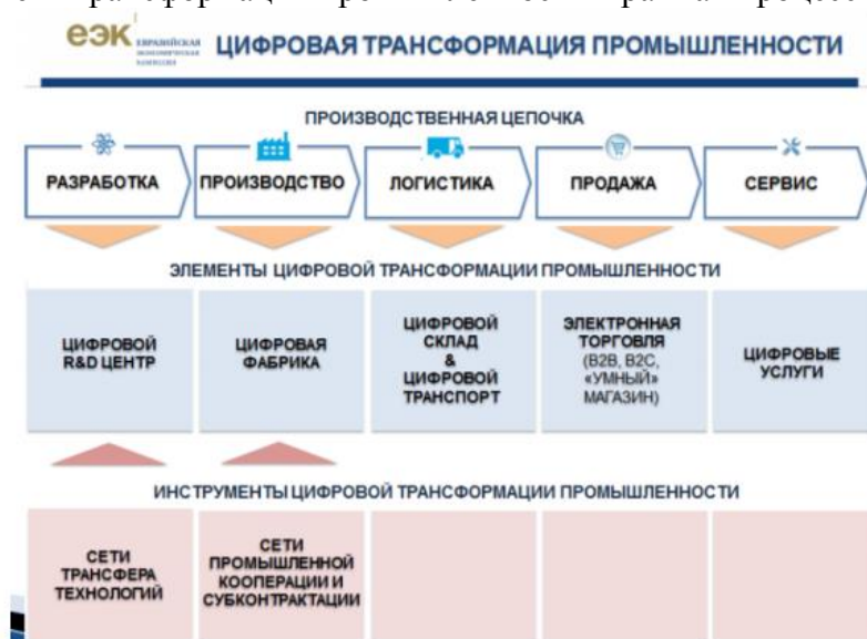
Рисунок 1 – Процессный подход