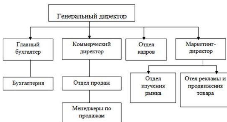
Рисунок 2.1- Организационная структура коммерческого предприятия наименование предприятия (составлено автором)