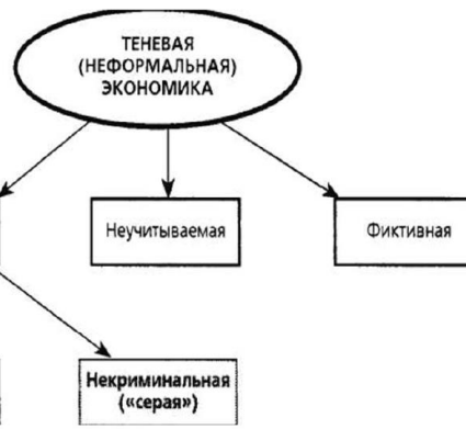
Рис. 2. Статистический подход к типологизации

Задание 2. Внесите в схему (рис. 3) недостающую информацию.