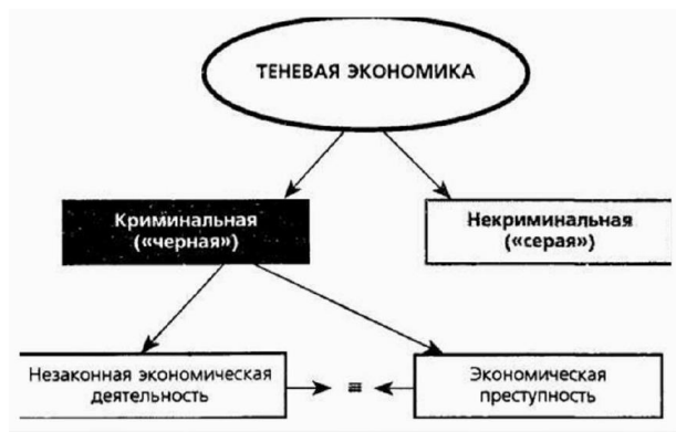
Рис. 1. Правовой подход к типологизации