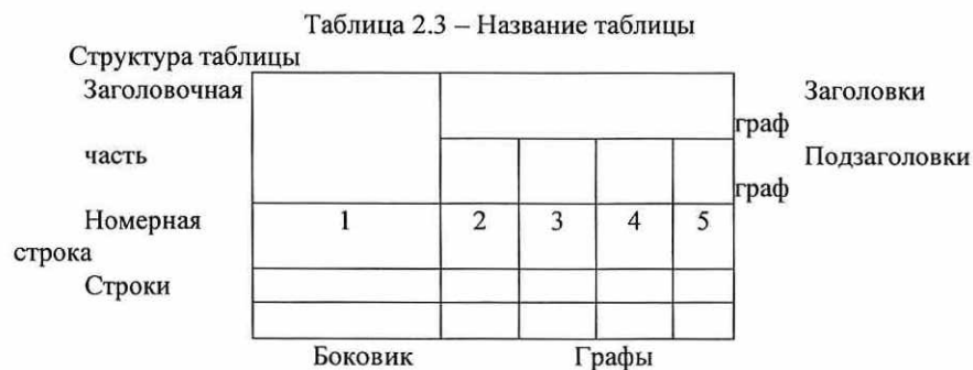
Рисунок 1 - Схема оформления таблицы

Форма самой таблицы содержит: "заголовочную часть", "боковик", "строки", "графы", как это представлено на рисунке 1.