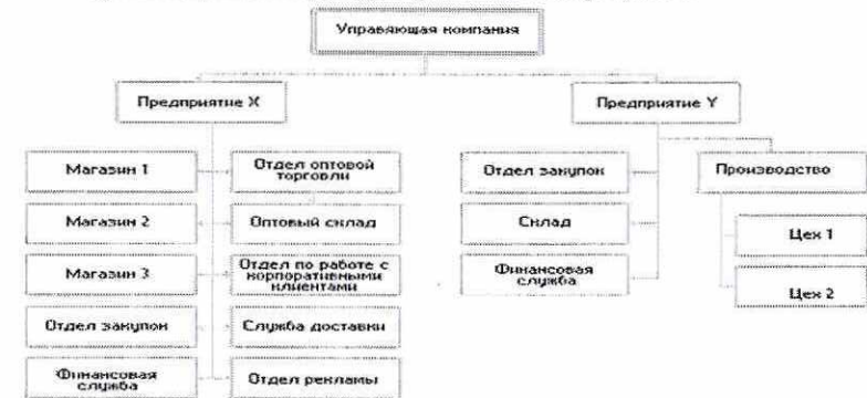
Рисунок 1. Организационная структура ООО «Стройсервис»

Организационная структура представлена на рисунке 1.