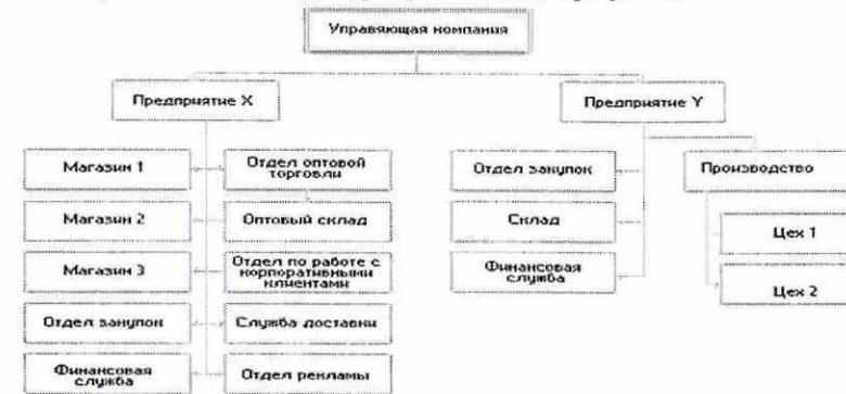
Рисунок 1. Организационная структура ООО «Стройсервис»

Организационная структура представлена на рисунке 1.