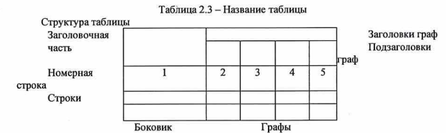
Рисунок 1 - Схема оформления таблицы

Форма самой таблицы содержит: "заголовочную часть", "боковик", "строки", "графы", как это представлено на рисунке 1.