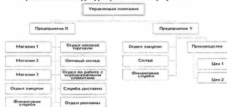
Рисунок 1. Организационная структура ООО «Стройсервис»

Организационная структура представлена на рисунке 1.