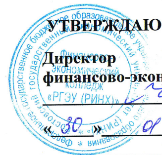
График ликвидации академической задолженности студентов отделения «Экономика» очной формы обучения Специальность 38.02.08 Торговое дело в период с 10.02.2025 г. по 22.02.2025 г.