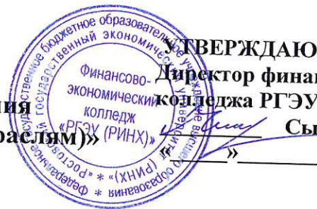
График ликвидации академической задолженности студентов заочной формы обучения заочной формы обучения специальности 38.02.01 «Экономика и бухгалтерский учет (по отраслям)» в период с 01.10.2024 г. по 19.10.2024 г.