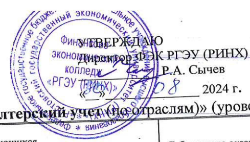
ГРАФИК УЧЕБНОГО ПРОЦЕССА ФИНАНСОВО-ЭКОНОМИЧЕСКОГО КОЛЛЕДЖА РГЭУ (РИНХ) Заочная форма обучения на 2024 – 2025 учебный год