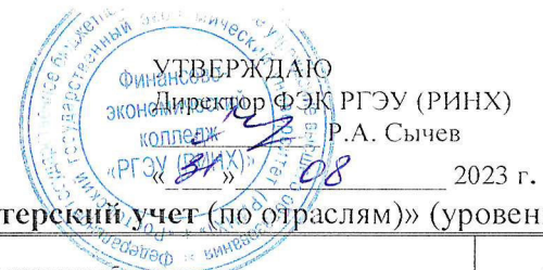
ГРАФИК УЧЕБНОГО ПРОЦЕССА ФИНАНСОВО-ЭКОНОМИЧЕСКОГО КОЛЛЕДЖА РГЭУ (РИНХ) Заочная форма обучения на 2023 – 2024 учебный год