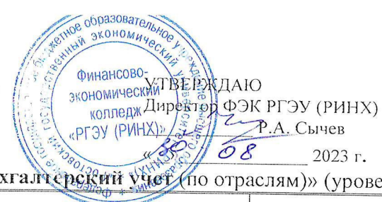
ГРАФИК УЧЕБНОГО ПРОЦЕССА ФИНАНСОВО-ЭКОНОМИЧЕСКОГО КОЛЛЕДЖА РГЭУ (РИНХ) Заочная форма обучения на 2023 – 2024 учебный год