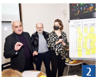
Дороржная карта НИД