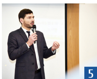
Х Зимняя школа