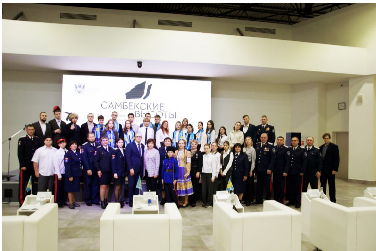
Состоялись IV Всероссийские научные чтения по гражданской и военной истории казачества «Таганрог – Раздоры».

Организаторы чтений – факультет Истории и филологии Таганрогского института имени А.П. Чехова (филиала) РГЭУ (РИНХ) и Раздорский этнографический музей-заповедник при поддержке Народного военно-исторического музейного комплекса Великой Отечественной войны «Самбекские высоты», ЮНЦ РАН, Государственного архива РО и юртового казачьего общества «Неклиновский юрт».