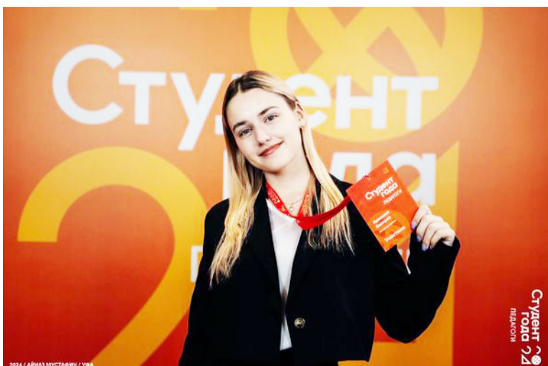
С 22 по 26 октября в г. Уфе проходил финал III Всероссийского конкурса «Студент года. Педагоги».

В столице Республики Башкортостан собрались 100 студентов педагогических специальностей из 46 регионов России. Все они – победители отборочных туров конкурса.