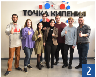
Интенсив «Осень 2022»