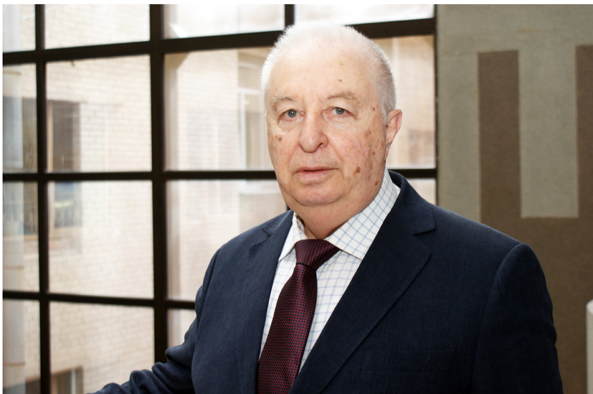
ВЛАДИМИР ЗОЛОТАРЁВ, ЗАСЛУЖЕННЫЙ ДЕЯТЕЛЬ НАУКИ РФ, Д.Э.Н., ПРОФЕССОР

Масштаб личности лидера задает масштаб вуза. Во времена его ректорства были проведены коренные преобразования в учебной, методической, научно-исследовательской деятельности, получили развитие материально-техническая база и социальная сфера. По сути был создан новый государственный университет гуманитарного профиля, обладающий уникальными возможностями существенного влияния на развитие интеллектуального потенциала и научно-исследовательского обеспечения роста экономики области и региона.