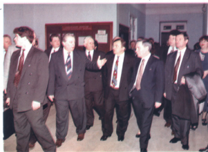
Бывший студент РФФИ Премьер-министр Венгрии Дьюла Хори посещает свою альма-матер. 1996 год.