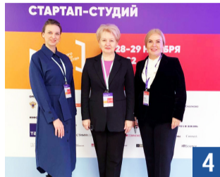
Форум стартап- студий