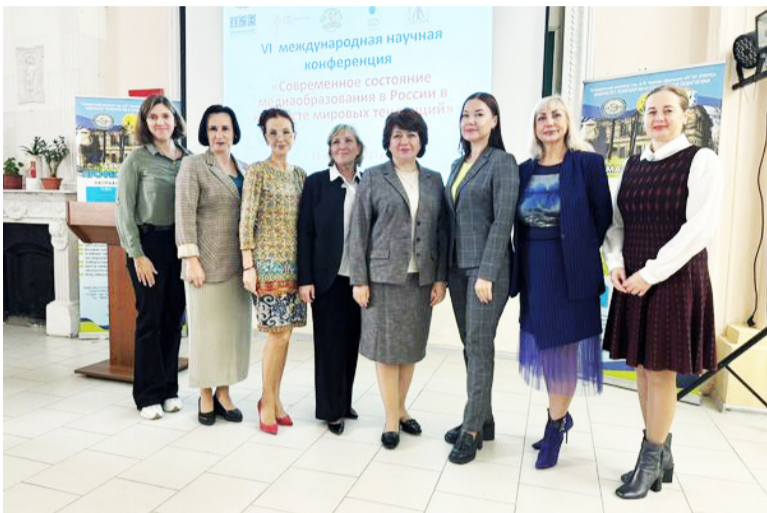
18 октября в Таганрогском институте имени А.П. Чехова (филиале) РГЭУ (РИНХ) состоялась VI Международная научная конференция «Современное состояние медиаобразования в России в контексте мировых тенденций».

IV Международная конференция «Современное состояние медиаобразования в России в контексте мировых тенденций» организована коллективом кафедры психолого-педагогического образования и медиакоммуникации Таганрогского института имени А.П. Чехова (филиала) Ростовского государственного экономического университета (РИНХ) и НОЦ «Медиаобразование и медиакомпетентность».