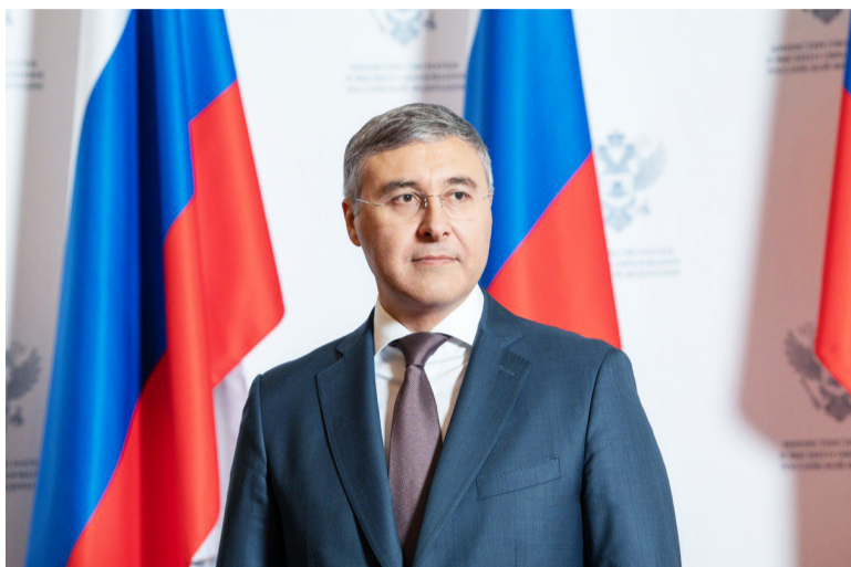
Глава Минобрнауки Валерий Фальков доложил Президенту РФ об итогах приемной кампании в вузах, целевом наборе студентов.

– Приемная кампания показала образование – подано около в первую очередь сохраняю- 8 млн заявлений от более чем щий высокий спрос на высшее миллиона абитуриентов. По ва-