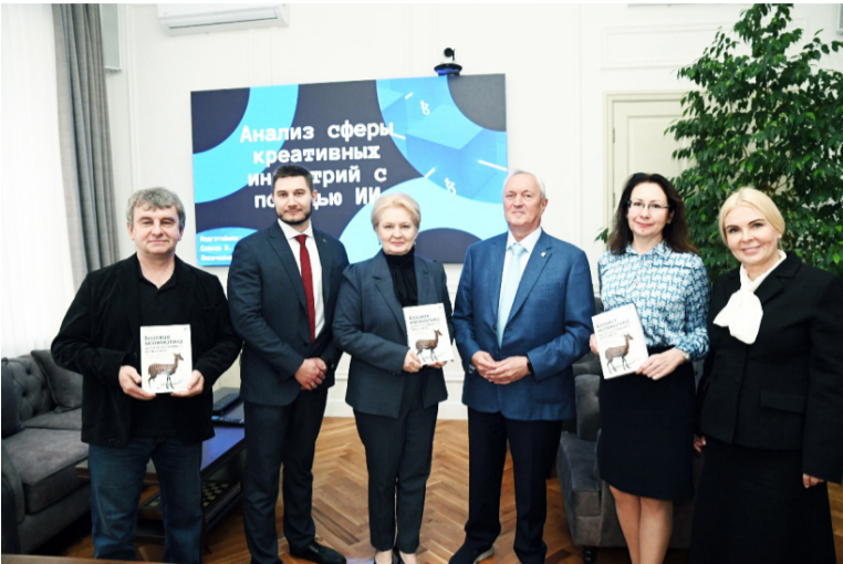
На площадке Профессорского клуба Ростовского государственного экономического университета (РИНХ) состоялась рабочая встреча студентов и наставников Центра искусственного интеллекта РГЭУ (РИНХ).

17 сентября в Профессорском клубе Ростовского государственного экономического университета (РИНХ) произошло значимое событие – подписание соглашения с ПАО КБ «Центр-инвест» об открытии Центра искусственного интеллекта.