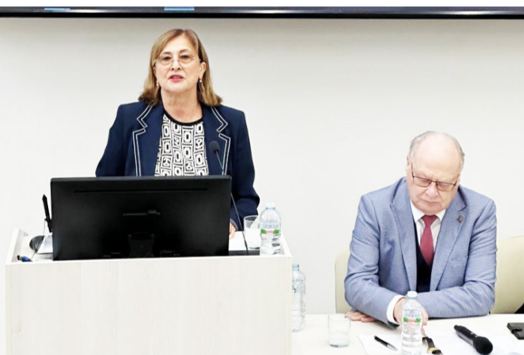
В г. Москве на базе РГАУ-МСХА имени К.А. Тимирязева в рамках аграрной выставки страны «Золотая осень-2024» прошел форум «Научное обеспечение продовольственной безопасности в условиях глобальных вызовов».

Форум, одно из основных тематических событий года в области сельскохозяйственных наук, прошел 10 октября в рамках 26-й Российской агропромышленной выставки «Золотая осень-2024».