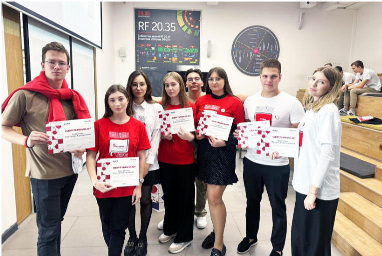
Студенты государственно-правового профиля – победители отборочной игры областного чемпионата по дебатам «Глаголь».

Организатором мероприятия выступила Избирательная комиссия Ростовской области. 16 октября студенты Таганрогского института имени А.П. Чехова (филиала) РГЭУ (РИНХ) приняли участие в областных дебатах «Глаголь».