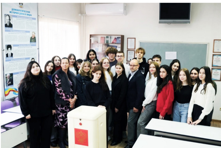
Студенты 3-го курса Финансово-экономического колледжа РГЭУ (РИНХ) побывали на экскурсии на Юридическом факультете РГЭУ (РИНХ).

Они поучаствовали в деловой игре под названием «Выборы