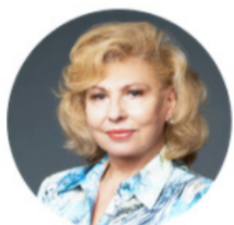
Москалькова Татьяна Николаевна Уполномоченный по правам человека в Российской Федерации