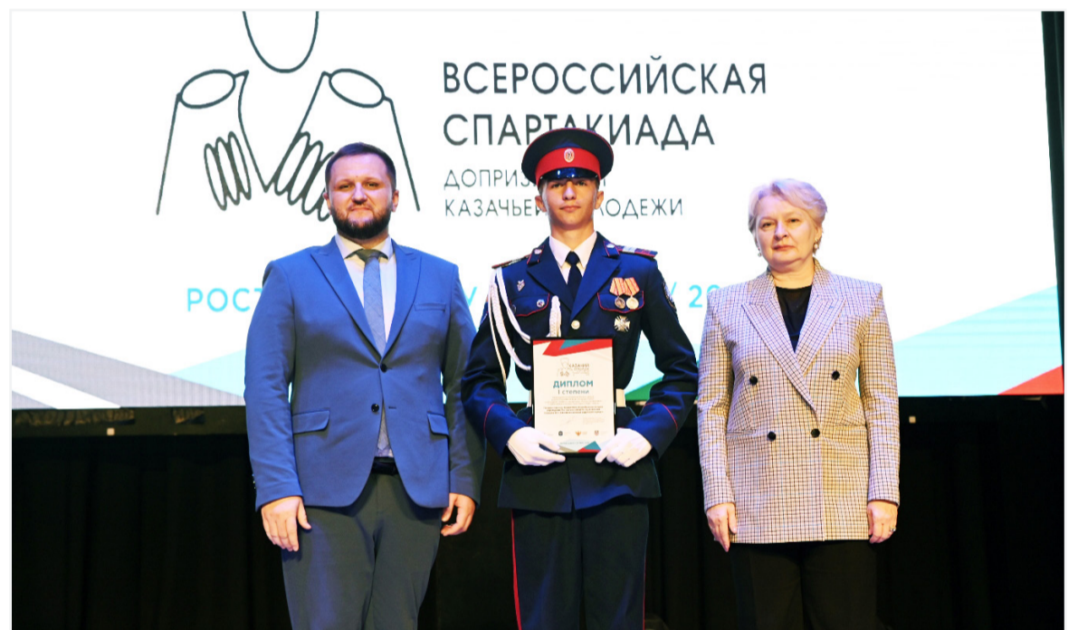
11 октября в РГЭУ (РИНХ) состоялась торжественная церемония закрытия и награждения победителей и призеров всероссийских этапов Всероссийской военно-спортивной игры «Казачий сполох» и Всероссийской спартакиады допризывной казачьей молодежи.

Соревнования проводятся Минпросвещения РФ при поддержке комиссии по содействию развитию системы казачьего образования Совета при Президенте РФ по делам казачества.