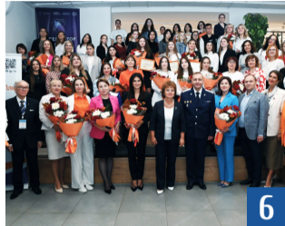
Конкурс «Бухгалтер Дона»