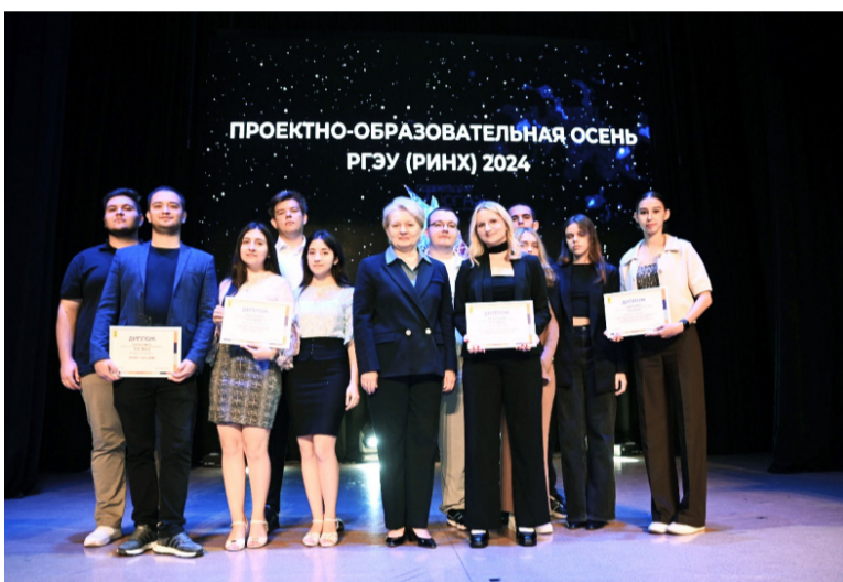
9 октября в РГЭУ (РИНХ) состоялось торжественное открытие третьей по счету Проектно-образовательной осени-2024.

Проектно-образовательная осень включает три масштабных направления развития и поддержки студенческого технологического предпринимательства и проектной деятельности: акселерационную программу «Созвездие Юга» для стартапов под эгидой Росмолодежи; проектно-образовательный интенсив для кейсов от промышленных партнеров совместно с Университетом 20.35; блок проектно-ориентированных сервисов, направленных на вовлечение в технологическое предпринимательство и проектную деятельность совместно с платформой университетского технологического предпринимательства.