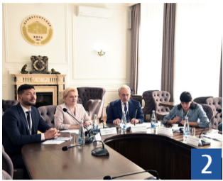
XVIII логистический форум