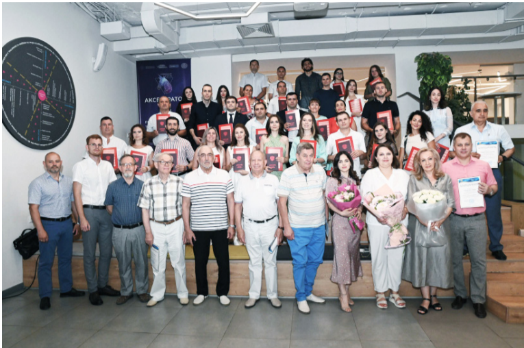
Одно из важных направлений деятельности университета – подготовка кадров высшей квалификации в аспирантуре и докторантуре.

Аспирантура университета год от года показывает устойчивую тенденцию развития. В 2023 г. в аспирантуре обучалось 449 человек, 441 аспирант и 8 соискателей, что существенно выше показателей предшествующего года. Структура контингента с 2019 по 2023 г. наглядно иллюстрирует тенденцию изменений в разрезе форм обучения. Соотношение аспирантов очной и заочной форм существенно не менялось в 2019-2021 гг. и составляло 40% и 60%. В 2022 г. произошла смена тенденции – численность аспирантов очной формы превысила численность заочной (в 2023 г. 79% и 21%, в 2022 г. – 56% и 44%). Это связано с тем, что в соответствии с законодательством прием в аспирантуру в 2022-2023 гг. осуществлялся только на очную форму.