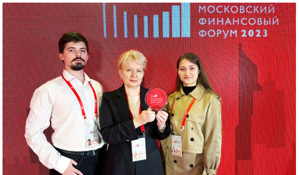
28 сентября открылся VII Московский финансовый форум, организаторами которого выступили Министерство финансов Российской Федерации и Правительство г. Москвы.

Московский финансовый форум – авторитетная площадка для обсуждения финансовой и бюджетной политики государства, актуальных вопросов развития отечественного финансового сектора. На прошлогоднем форуме обсуждалась реальность ведения суверенной политики, в этом году тема звучала более глобально: «В поисках нового баланса: российская финансово-экономическая система в период мировой трансформации».