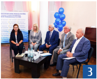
Заседание профессорского клуба