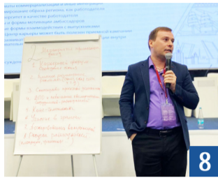
Неделя охраны труда