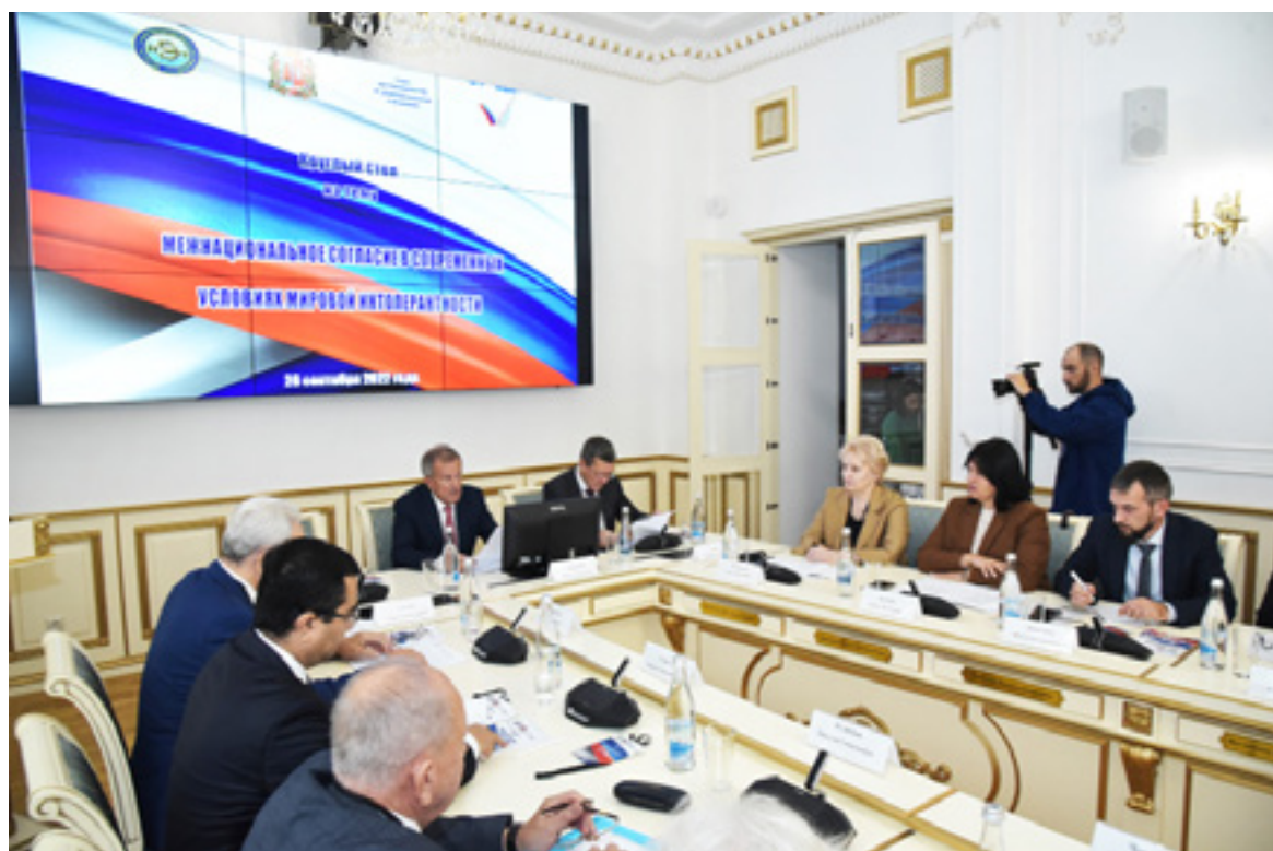
28 сентября в зале Ученого совета Ростовского государственного экономического университета (РИНХ) состоялось заседание круглого стола «Межнациональное согласие в современных условиях мировой интолерантности».

Проведение круглого стола организовано Общественной палатой г. Ростова-на-Дону совместно с региональным отделением общероссийского общественного движения «Народный фронт «За Россию» в Ростовской области. Его цель – обсуждение вопросов межкультурного и межнационального диалога в современных условиях, тенденций и направлений развития межнационального взаимодействия.