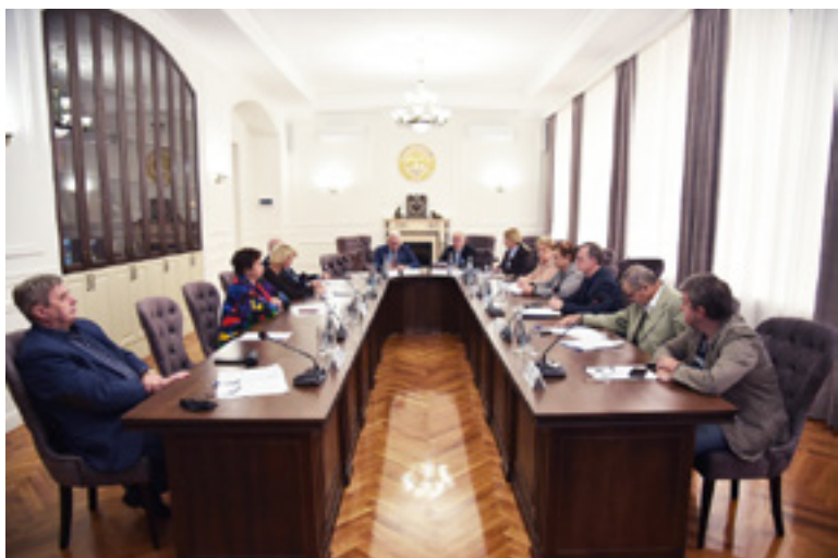
4 октября состоялось очередное заседание Профессорского клуба РГЭУ (РИНХ).