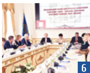
Сохранение культурного наследия