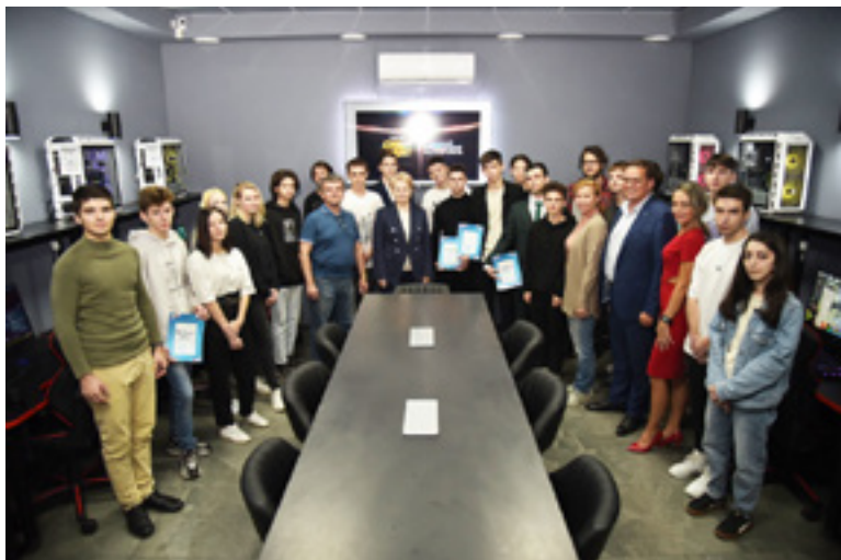
14 и 15 сентября в студенческом киберспортивном клубе CyberLight RSUE прошел внутривузовский турнир по дисциплине Valorant.

Киберспортивный клуб Ростовского государственного экономического университета (РИНХ) функционирует в тесном сотрудничестве с Федерацией киберспорта Ростовской области, курирует его развитие депутат Государственной Думы Федерального Собрания Российской Федерации Лариса Тутова.