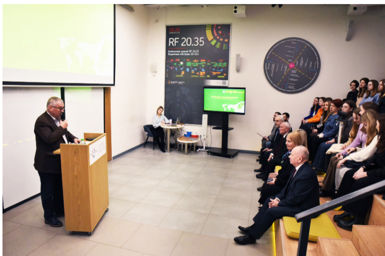
27 января в Предпринимательской точке кипения РГЭУ (РИНХ) прошла презентация результатов хакатона для экономистов «Экономика трансформаций».

Цель хакатона – интенсивная подготовка специалистов по экономике трансформаций. Трансформации – новая реальность, постоянные изменения в условиях непрерывных кризисов. Структурная трансформация охватывает трансформацию ре-