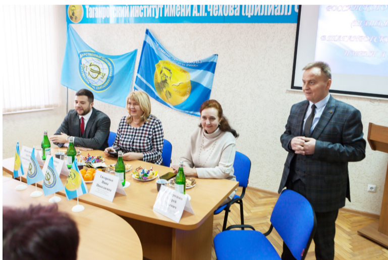
25 января в День российского студенчества в Таганрогском институте имени А.П. Чехова (филиале) РГЭУ (РИНХ) состоялась встреча администрации института и депутатского корпуса городской думы г. Таганрога с лучшими студентами-первокурсниками, преподавателями, сотрудниками института – Татьянами.