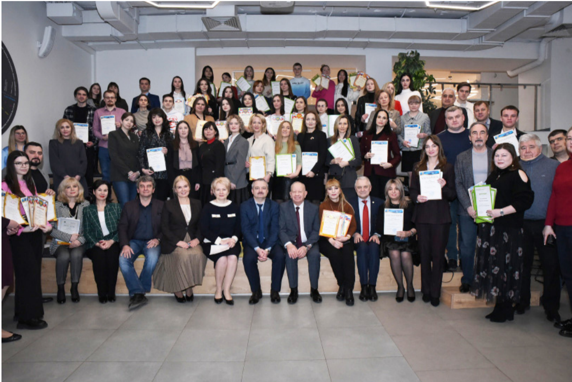
2 февраля по традиции в канун Дня Российской науки в Педпринимательской точке кипения Ростовского государственного экономического университета (РИНХ) состоялось торжественное заседание Совета молодых ученых РГЭУ (РИНХ).

Несмотря на все препятствия и трудности престиж научной деятельности, ученого-исследователя в значительной степени вырос.