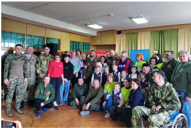
Кафедра психологии Таганрогского института имени А.П. Чехова (филиала) РГЭУ (РИНХ) совместно с коллективом АНО «Луч Надежды» подвела итоги одного из актуальных и социально значимых проектов 2024 г. «Эхо Души».