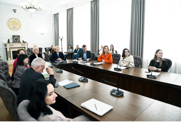
13 января в Профессорском клубе РГЭУ (РИНХ) состоялся региональный круглый стол «Студенческая наука в России: эпоха Ломоносова и современность», посвященный празднованию 270-летия МГУ имени М.В. Ломоносова.

В конце 1740-х основоположник российской науки Михаил Ломоносов в переписке с меценатом и фаворитом императрицы Елизаветы Петровны Иваном Шуваловым рассказывал о заграничных университетах, и Шувалов предложил создать в России новое учебное заведение на европейский манер.